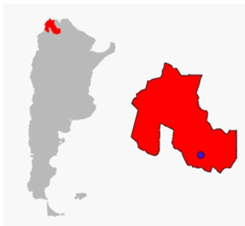
Figura N°1: contextualización geográfica de la provincia de Jujuy. Elaboración propia

La provincia se divide en 16 departamentos, agrupados en cuatro regiones. En el departamento Doctor Manuel Belgrano se localiza San Salvador de Jujuy, Ciudad Capital de la provincia. El ejido municipal, también incluye las localidades de La Almona, Guerrero, Villa Jardín de Reyes y Ocloyas.