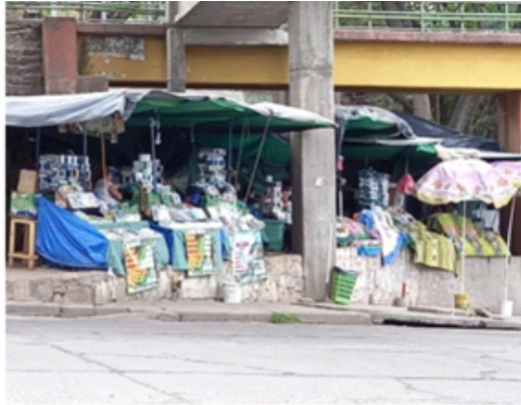
Puestos de venta