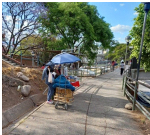
Mapeo Puesto de ventas ambulantes