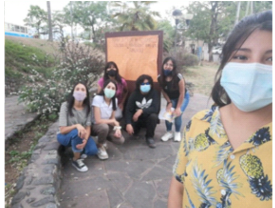
Equipo de práctica 2021