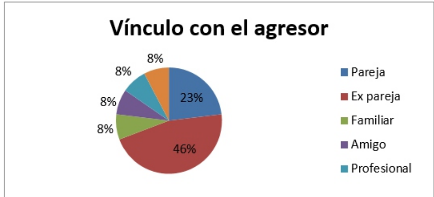
Figura 1. Vínculo con el agresor

En cuanto al tipo de agresión padecida las encuestadas refieren haber sufrido, en mayor medida, violencia psicológica y emocional (76,9%), seguida de violencia física y económica (30,8%) (Figura 2). Cabe destacar que en la mayoría de los casos se reportaron tres o cuatro tipos de violencia sufridas al mismo tiempo.