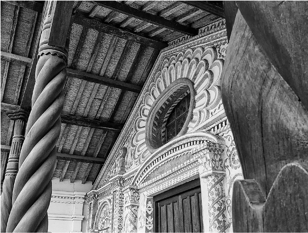
San Rafael – Detalle del rosetón en frente principal.