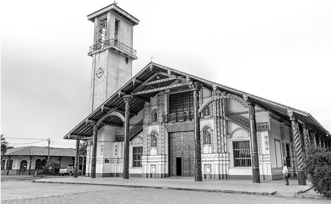
San Ignacio de Velasco – Vista de la catedral de San Ignacio.