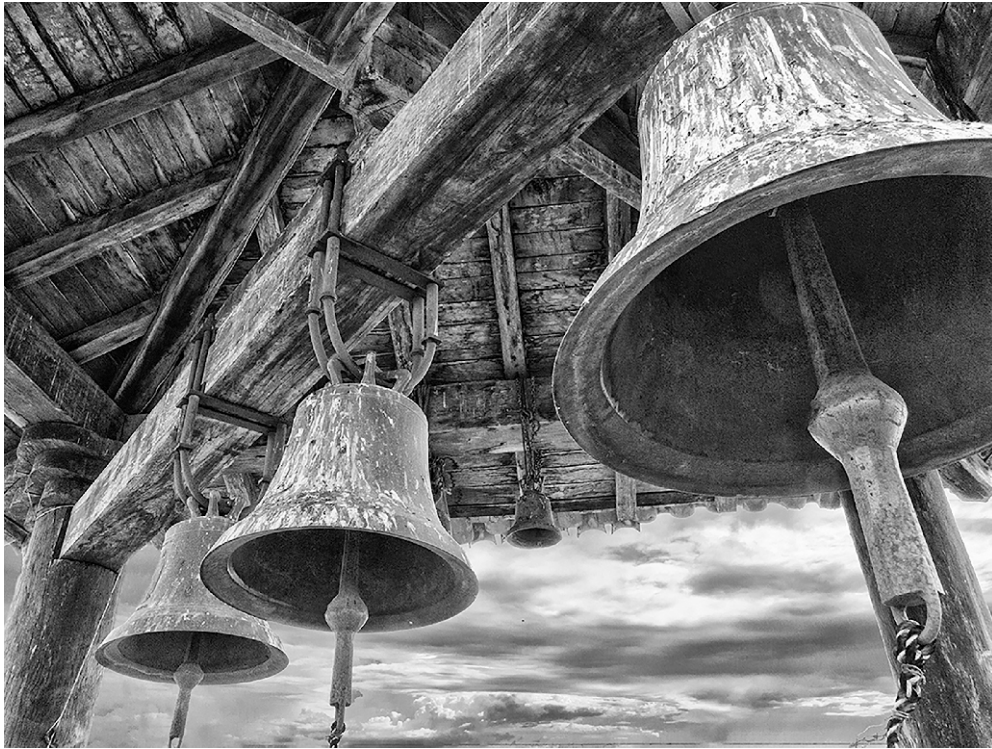
San Francisco Xavier – Campanario.