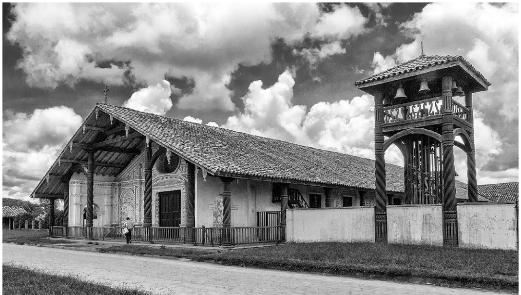
San Rafael – Vista de la iglesia y la torre campanario.