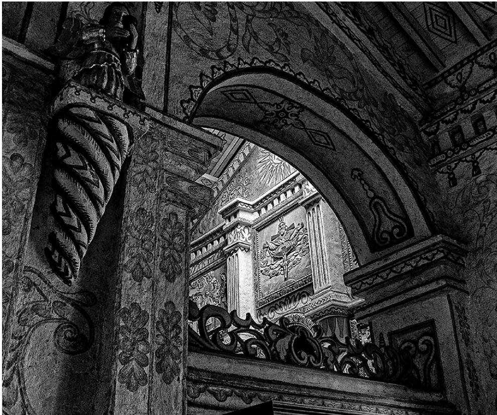
San Francisco Xavier – Detalle del retablo desde nave lateral.