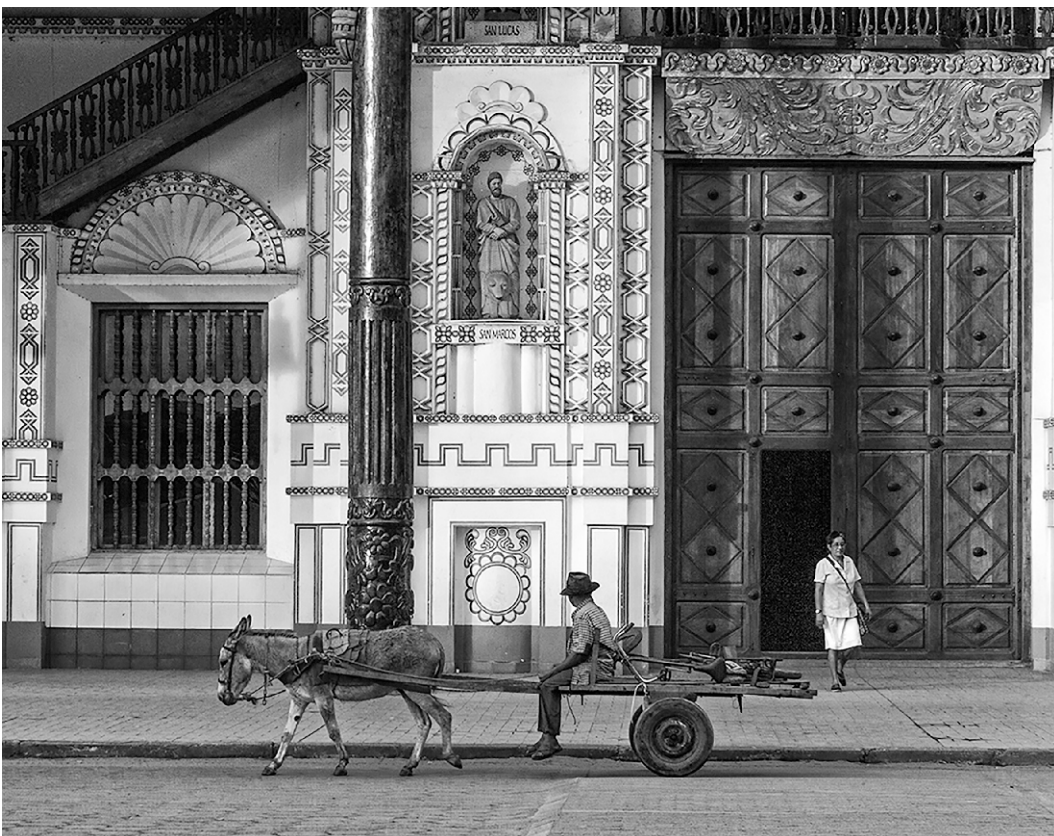
San Ignacio de Velasco – Detalle del ingreso.