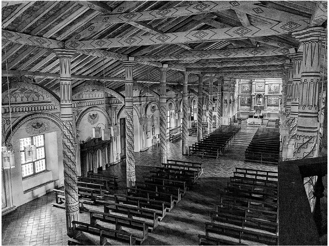
San Francisco Xavier – Vista desde el coro hacia la nave y el altar.