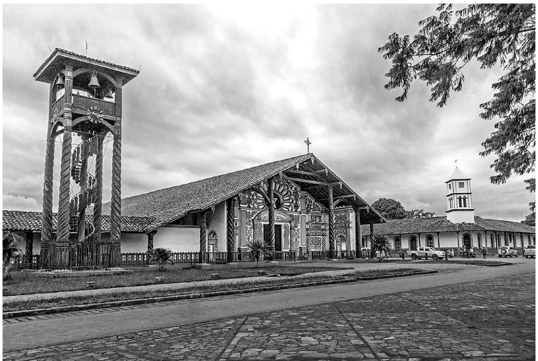
Concepción – Vista de la Catedral y el Municipio.