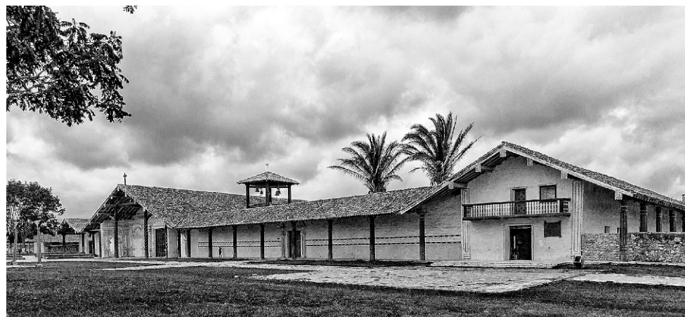
San Francisco Xavier – Vista del frente principal de la misión.