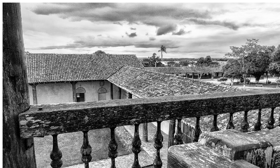
San Francisco Xavier - Vista desde el campanario hacia el claustro y plaza.