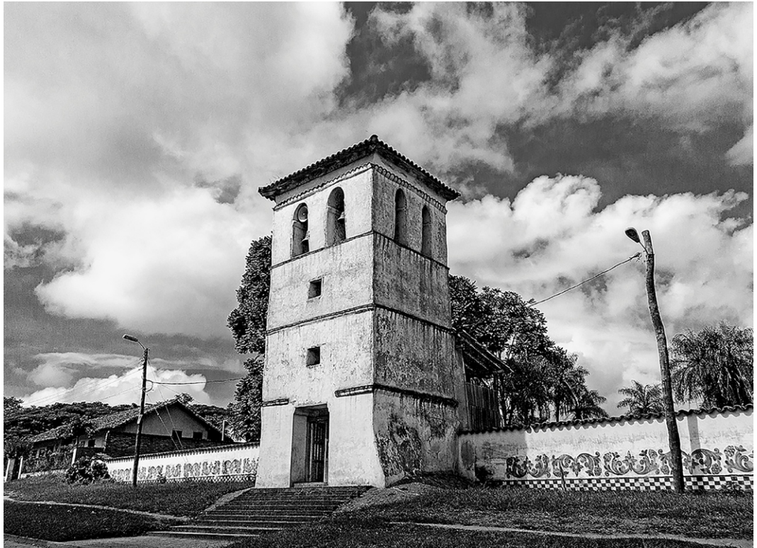
San Miguel de Velasco – Torre campanario.